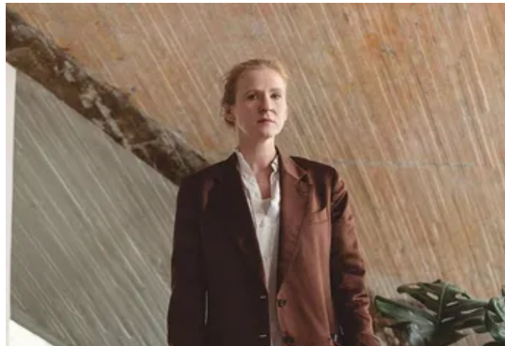
Alicja Kwade (Caylon Lawrence).

Explorando y cuestionando las estructuras de la realidad y la naturaleza de las cosas, la artista polaca reflexiona sobre la percepción del tiempo en nuestra vida cotidiana con su nueva exposición.